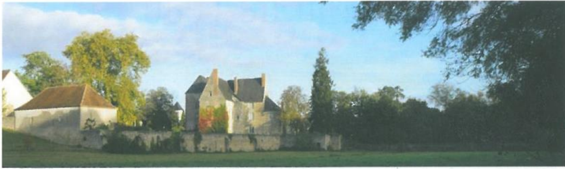
Musée Balzac, à Saché.

coopérative locale qui est également un musée bien vivant puisque les professionnels s'y relaient pour vous expliquer ces techniques qu'ils préservent comme un bien précieux.